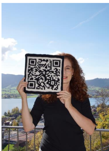
QR-Codes funktionieren auch gestrickt.