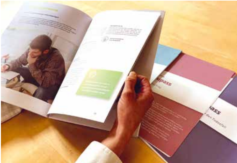
Zum Docupass von Pro Senectute können Interessierte sich kostenlos beraten lassen oder einen Kurs besuchen.

fähige Person in deren persönlichen Belangen vertritt. Gibt es im Fall einer Urteilsunfähigkeit keinen Vorsorgeauftrag, vertreten Ehepartner oder eingetragene Partner die Interessen der betroffenen Person oder aber die KESB bestimmt eine Beiständin oder einen Beistand.